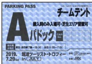
昨年までの搬入券

いつも筑波ツーリスト・トロフィーにご参加いただき 誠にありがとうございます。 Aパドックへの搬入の際にご使用いただいていた搬入券ですが、昨年1年間予告 させていただきました通り、今年から運用を下記の通り変更させていただきますの でご注意ください。