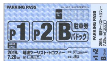
エントラント駐車券

ご不明な点等ございましたら大会事務局までお問い合わせください。 ご協力の程よろしく願いいたします。