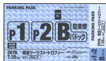
エントラント駐車券

ご不明な点等ございましたら大会事務局までお問い合わせください。 ご協力の程よろしく願いいたします。